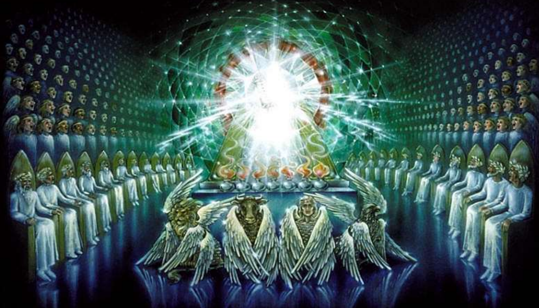
Artwork by Pat Marvenko Smith ©1982, 1992 www.revelationillustrated.com